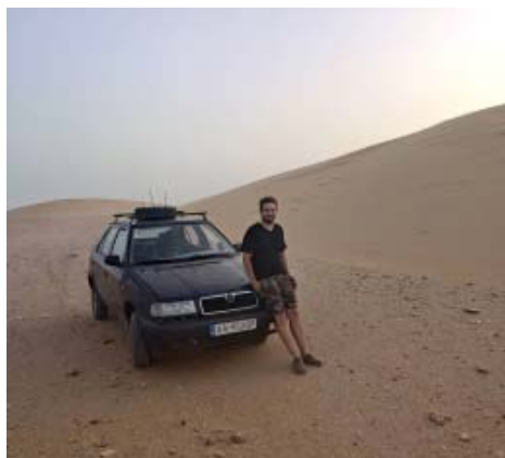
Západná Sahara, Maroko