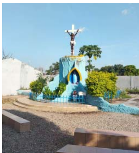
Kríž pri Cathedrale Notre Dame des Victoires et De La Paix De, Kankan, Guinea

Najviac ho fascinoval život v afrických mestách – ich energia, ruch a jednoduchosť. „Ludia si na ulici varia, kúpu sa